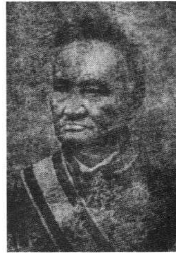
สมเด็จพระยาบรมมหาศรีสุริยวงศ์ (ช่วง บุนนาค)

ส่วนน้องชายของสมเด็จพระยาองค์ใหญ่ ซึ่งเป็นบุตรชายคนสุดท้ายของเจ้าพระยาอรรคมหาเสนา (บุนนาค) อีกท่านที่เกิดกับเจ้าคุณนวลชื่อเจ้าคุณชายตัดก็เข้ารับราชการในสมัยรัชกาลที่ 1 เป็นนายสนิทหุ้มแพรมหาดเล็ก จนถึงรัชกาลที่ 4 ได้เลื่อนตำแหน่งจากพระยาศรีพิพัฒนรัตนโกษา ขึ้นเป็นสมเด็จพระยาบรมมหาพิไชยญาติฯ คนทั่วไปนิยมเรียกขานว่า “สมเด็จพระยาองค์น้อย”