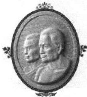
เจ้าพระยาอรรคมหาเสนา และเจ้าคุณพระราชพันธุ์ (นวล) ต้นสกุลบุญนาค

ครั้นถึงสมัยกรุงรัตนโกสินทร์เป็นราชธานี ปีพุทธศักราช ๒๓๒๕ หลังจากพระบาทสมเด็จพระพุทธยอดฟ้าจุฬาโลก รัชกาลที่ ๑ ทรงปราบดาภิเษกแล้วได้ทรงพระกรุณาโปรดเกล้าฯ แต่งตั้งพระบรมวงศานุวงศ์ซึ่งเคยทำความดีความชอบให้ดำรงตำแหน่งสำคัญๆ อาทิ เจ้าพระยาสุรสีห์ได้รับสถาปนาเป็นกรมพระราชวังบวรสถานมงคล เป็นต้น ทั้งยังทรงตั้งตำแหน่งเสนาบดีข้าราชการผู้ใหญ่ผู้น้อยหลายกรมกองสำหรับผู้สืบสายเจกอะหมัดที่เป็นต้นสายสกุลบุญนาคนั้นคือ นายฉลองไชนารถ (บุญนาค) บุตรเจ้าพระยามหาเสนา (เสน) น้องต่างมารดาของท่านบุญมา ได้เป็นพระยาอุไทยธรรม และในปลายรัชกาลที่ ๑ ได้เป็นเจ้าพระยาอรรคมหาเสนาที่สมุหพระกลาโหม