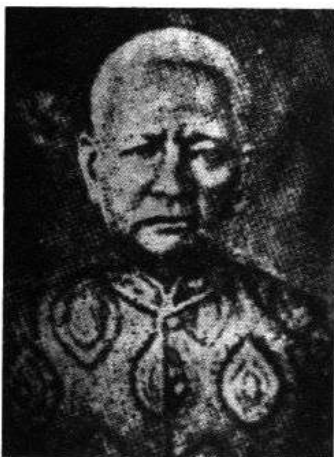
สมเด็จเจ้าพระยา บรมมหาประยูรวงศ์ (ดิศ ขุนนาค)

สมเด็จเจ้าพระยาบรมมหาประยูรวงศ์ (ดิศ ขุนนาค) ได้เป็นผู้สำเร็จราชการแผ่นดินในรัชกาลที่ 4 คนทั่วไปนิยมเรียกว่า “สมเด็จเจ้าพระยาองค์ใหญ่” และเป็นสมเด็จเจ้าพระยาองค์แรกของวังหลวง ซึ่งเป็นผู้มีอำนาจและมีอิทธิพลมากที่สุดในพระราชอาณาจักรรองจากพระบาทสมเด็จพระเจ้าอยู่หัวสองพระองค์ซึ่งเป็นเจ้าแผ่นดินและเจ้าชีวิต