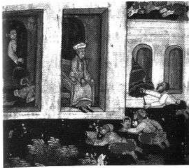
รูปขุนนางเปอร์เซีย ภาพจิตรกรรมฝาผนัง วัดโสมนัสวิหาร

ในการศึกษาเรื่องเกี่ยวกับประวัติวงศ์ ตระกูล จำเป็นอย่างยิ่งที่ต้องระมัดระวังในการใช้ หลักฐานทางประวัติศาสตร์ที่จะนำมาประกอบการ ค้นคว้า