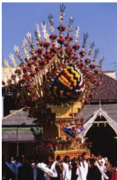
โตะระบัดในพิธีแห่เจ้าเซ็นของชาวกฎีเจริญพาศน์

ภายในโตะระบัดจะมีคัมภีร์อัลกุรอานบรรจุอยู่ พร้อมเปิดหน้าบทความอดทน เพื่อเป็นคำสอนให้ชาวมุสลิม ชีอะห์อดทนต่อความเจ็บปวดรเวร้าวต่าง ๆ