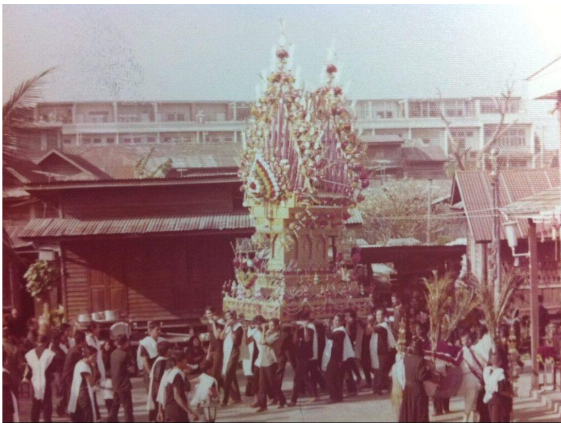
พิธีแห่เจ้าเซ็นที่มีสยิดผดุงธรรมอิสลาม เขตบางกอกใหญ่ กรุงเทพฯ, ไม่ระบุปี

ตลเดือนเรียกมหาร่ำ ซีนสองคำแซกตั้งการ เจ้าเซ็นลิววันวาร ประหารอก ฟกพูนันน์ มหาร่ำเรียมคอยเคร่า ไม่เห็นเจ้าเศร้าเสียใจ ลือกอ้ออาลัย ลาลดล้า กำศรวลเซ็น”