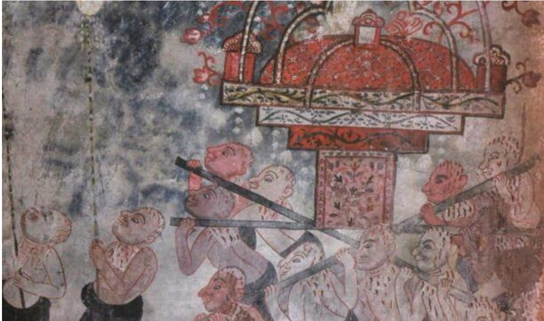
จิตรกรรมฝาผนังภายในพระอุโบสถ เขียนภาพขบวนแห่เจ้าเซ็นในนิกายชีอะห์