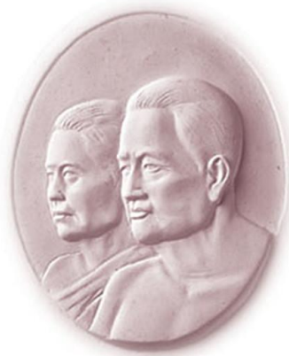
เจ้าพระยามหาเสนา และเจ้าคุณพระราชพันธุ์นวล