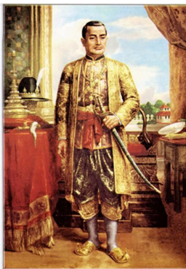
พระบาทสมเด็จพระพุทธยอดฟ้าจุฬาโลกมหาราช

รุ่งเรืองมาถึงปัจจุบัน กับต้นตระกูลของสกุลที่มีลูกหลานเข้ารับราชการและมีบทบาทสำคัญในราชสำนักแห่งกรุงรัตนโกสินทร์มาหลายรัชกาล