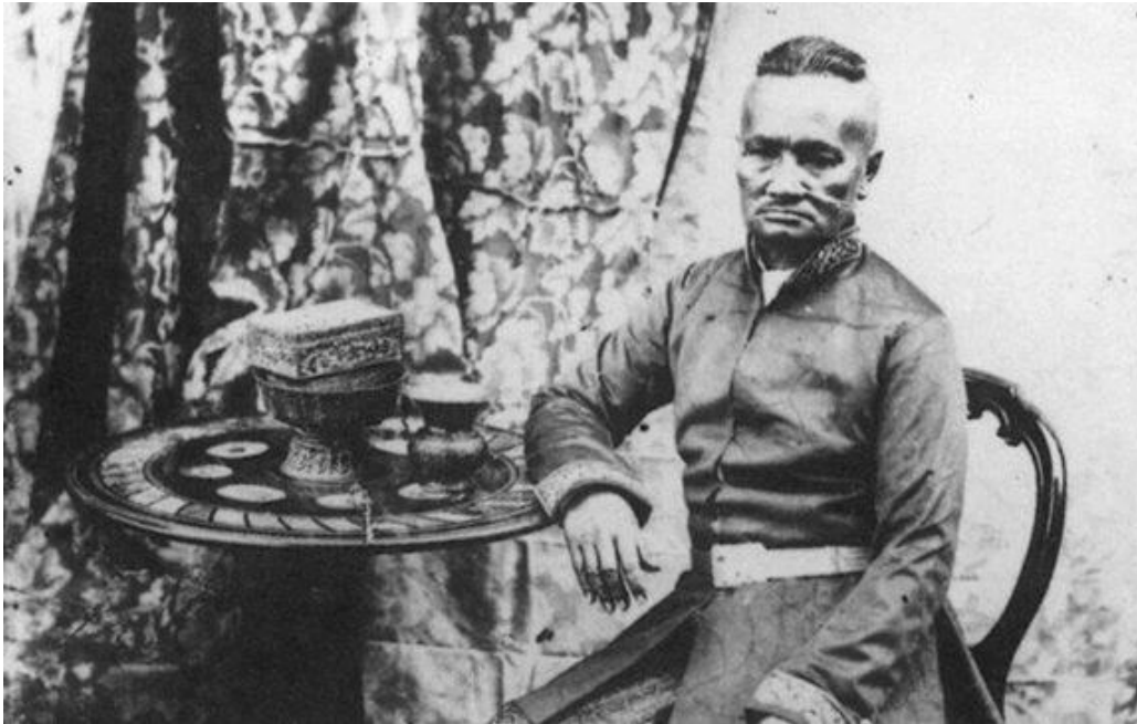
สมเด็จพระเจ้าพระยาบรมมหาศรีสุริยวงศ์ (ช่วง บุนนาค)