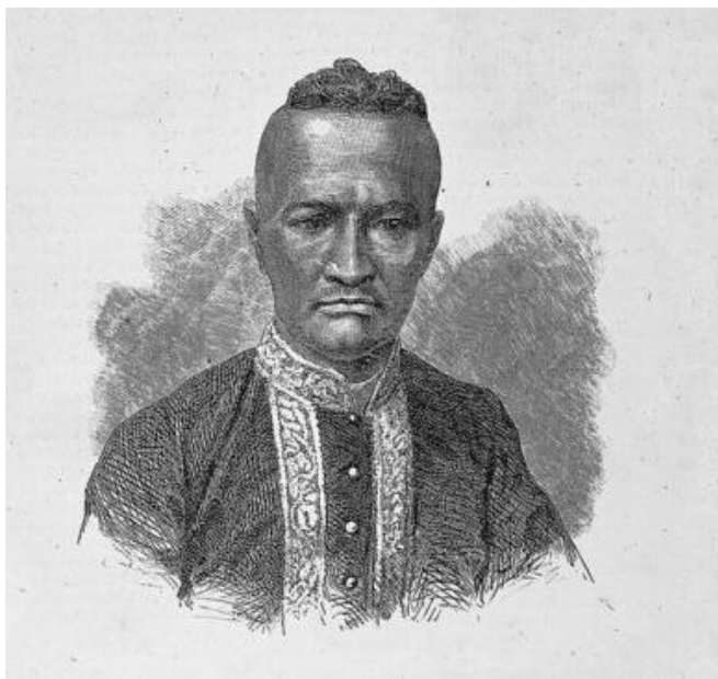
สมเด็จพระเจ้าพระยาบรมมหาศรีสุริยวงศ์ (ช่วง บุนนาค)

ถนนสมเด็จพระเจ้าพระยา ตั้งอยู่ในพื้นที่เขตคลองสาน กรุงเทพมหานคร หลายคนเมื่อได้ยินชื่อถนนเส้นนี้แล้ว อาจสงสัยว่า หมายถึง “สมเด็จพระเจ้าพระยา” ท่านไหน?