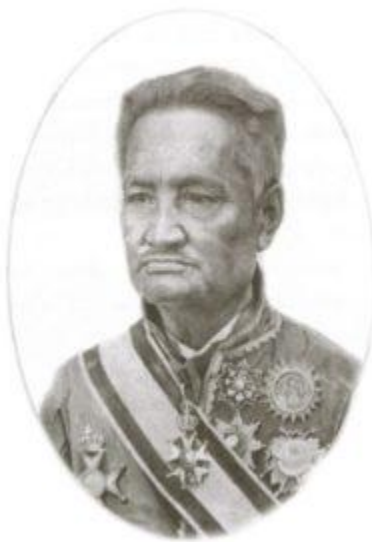
สมเด็จพระยาบรมมหาศรีสุริยวงศ์ (ช่วง บุนนาค) ผู้บัญชาราชการแผ่นดิน