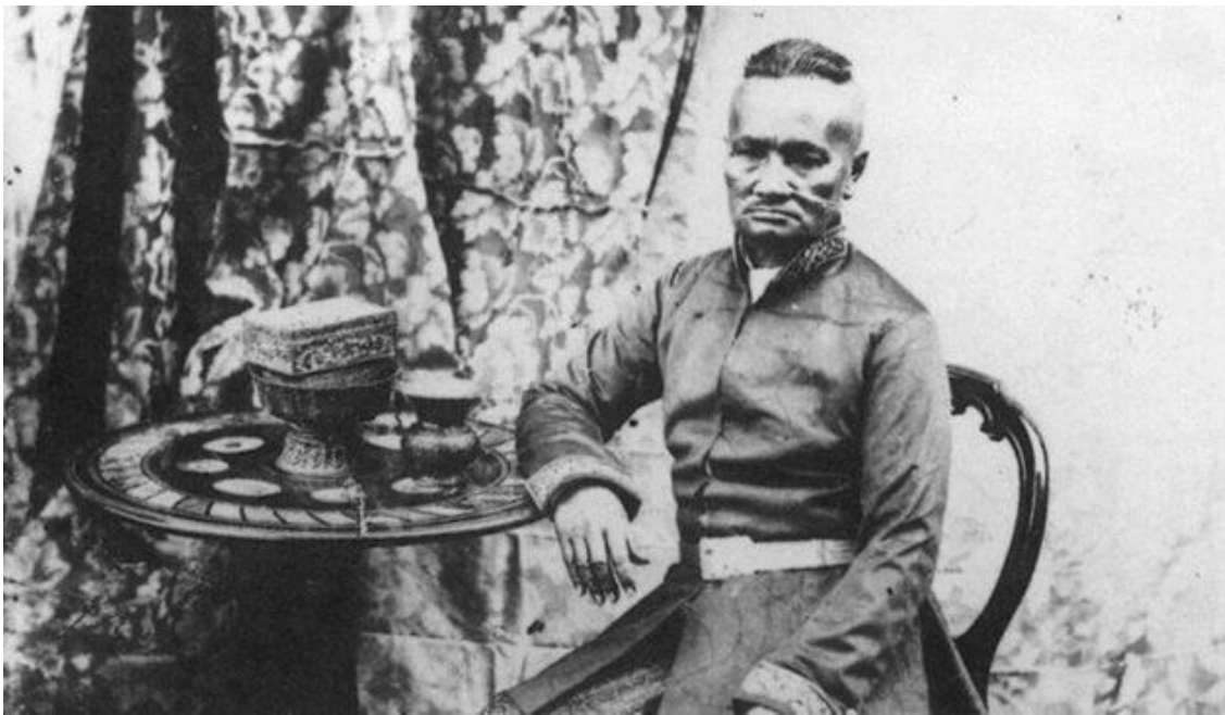
สมเด็จพระยาบรมมหาศรีสุริยวงศ์ (ช่วง บุนนาค)

สมเด็จพระยาบรมมหาศรีสุริยวงศ์ (ช่วง บุนนาค) หรือเรียกกันว่า “สมเด็จพระช่วง” เป็นข้าราชการชั้นผู้ใหญ่คนสำคัญของสยาม ด้วยความสามารถที่มีมากจึงทำให้ท่านเป็น “ผู้สำเร็จราชการแผ่นดิน (ผู้สำเร็จราชการแทนพระองค์)” ในสมัยพระบาทสมเด็จพระจุลจอมเกล้าเจ้าอยู่หัว รัชกาลที่ 5 เนื่องจากขณะนั้น รัชกาลที่ 5 ยังไม่ทรงบรรลุนิติภาวะ