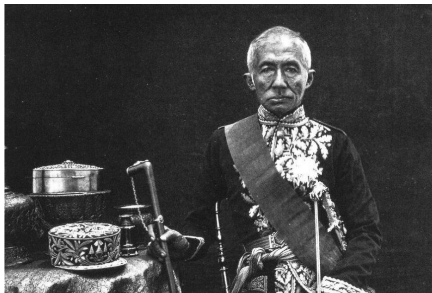
พระบาทสมเด็จพระจอมเกล้าเจ้าอยู่หัว รัชกาลที่ 4