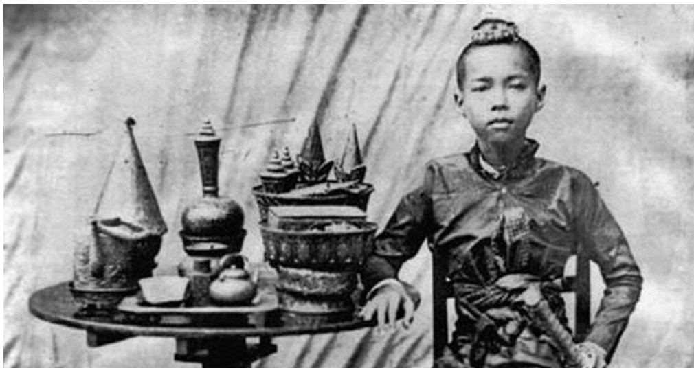
พระบาทสมเด็จพระจุลจอมเกล้าเจ้าอยู่หัว ขณะพระชันษา 9 พรรษา (ภาพจากหนังสือ “ประชุมภาพประวัติศาสตร์แผ่นดินพระบาทสมเด็จพระจอมเกล้าเจ้าอยู่หัว” จัดพิมพ์โดยกรมศิลปากร)

“ภาษาอังกฤษ” ก็เป็นอีกหนึ่งความสามารถของสมเด็จพระเจ้าอยู่หัว ที่ทำให้ท่านโดดเด่นกว่าขุนนางคนอื่น ๆ สมเด็จพระเจ้าอยู่หัว (ช่วง บุนนาค) เรียนภาษาอังกฤษที่ไหน อย่างไร? เรื่องนี้ สมเด็จพระเจ้าบรมวงศ์เธอ กรมพระยาดำรงราชานุภาพ ทรงเล่าไว้ในหนังสือ “ประวัติสมเด็จพระเจ้าบรมมหาราชครูสุริยวงศ์ เมื่อก่อนเป็นผู้สำเร็จราชการแผ่นดิน” ว่า สมเด็จพระเจ้าอยู่หัวเรียนภาษาอังกฤษกับเหล่ามิชชันนารีอเมริกัน พระองค์ทรงเล่าว่า แม้คนเหล่านี้จะเข้ามาเนื่องด้วยศาสนาเป็นหลัก แต่ก็ยังยินดีจะสอนภาษาอังกฤษและวิชาความรู้ต่าง ๆ ของฝรั่งให้คนอื่น รวมถึงช่วยเรื่องการแพทย์รักษาคนไทย