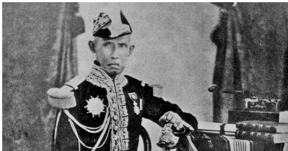
พระบาทสมเด็จพระปิ่นเกล้าเจ้าอยู่หัว

3. พระเจ้าบรมวงศ์เธอ กรมหลวงวงศาธิราชสนิท เดิมทีพระองค์ทรงเชี่ยวชาญเรื่องแพทย์แผนไทยอยู่แล้ว แต่ก็ทรงศึกษาวิชาแพทย์ฝรั่งเพิ่มอีก แต่ไม่มีพระประสงค์เรียนภาษาอังกฤษ นี่จึงพอเป็นคำตอบได้ว่า “สมเด็จพระช่วง” เรียนภาษาอังกฤษจากไหน อย่างไร