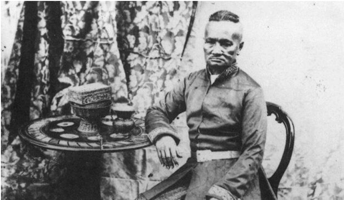
สมเด็จพระยาบรมมหาศรีสุริยวงศ์ (ช่วง บุนนาค)

สมเด็จพระยาบรมมหาศรีสุริยวงศ์ (ช่วง บุนนาค) หรือเรียกกันว่า “สมเด็จพระช่วง” เป็นข้าราชการชั้นผู้ใหญ่คนสำคัญของสยาม ด้วยความสามารถที่มีมากจึงทำให้ท่านเป็น “ผู้สำเร็จราชการแผ่นดิน (ผู้สำเร็จราชการแทนพระองค์)” ในสมัยพระบาทสมเด็จพระจุลจอมเกล้าเจ้าอยู่หัว รัชกาลที่ 5 เนื่องจากขณะนั้น รัชกาลที่ 5 ยังไม่ทรงบรรลุนิติภาวะ