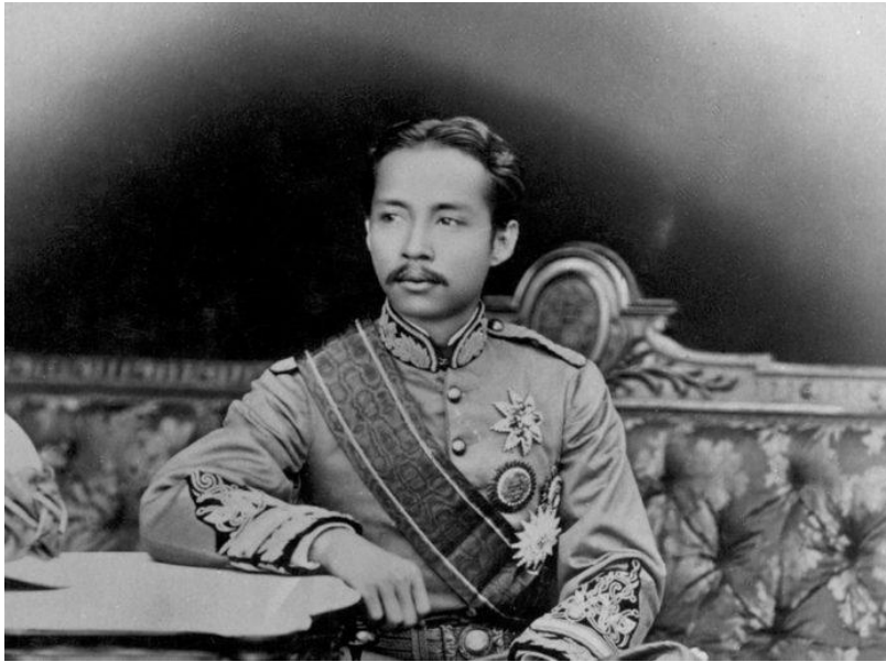
พระบาทสมเด็จพระจุลจอมเกล้าเจ้าอยู่หัว รัชกาลที่ 5

หนังสือพิมพ์จากฝรั่งเศสอายุเก่าแก่ถึง 147 ปี แจ้งข่าวความคืบหน้าการปลดแผ่นดินในประเทศไทยสยามเมื่อปี ค.ศ. 1868 ว่ากษัตริย์องค์ใหม่ผู้เยาว์วัยได้รับการแต่งตั้งโดยหัวหน้าขุนนางจากตระกูลที่ทรงอำนาจที่สุดให้สืบทอดราชวงศ์และจะเป็นผู้หนุนหลังรัชกาลใหม่ในฐานะผู้สำเร็จราชการแผ่นดิน ทว่า กษัตริย์องค์ใหม่กลับโต้แย้งว่าทรงถูกเบียดบังอำนาจและเหล่าขุนนางถูกครอบงำโดยผู้สำเร็จราชการคนนี้ แล้วใครกันแน่ที่อยู่ข้างหลังบัลลังก์เมื่อเริ่มต้นรัชกาลที่ 5? ท่ามกลางความผันผวนและเปลี่ยนตัวผู้นำประเทศ บุรุษอีกคนหนึ่งต่างหากที่เป็นแขนขาและดวงตาของกษัตริย์อย่างแท้จริง ในฐานะผู้สำเร็จราชการคนที่ 2 คนภายนอกประเทศผู้อ่านข่าวหนังสือพิมพ์ฝรั่งเศสมักจะเข้าใจอย่างผิดเพี้ยนถึงความเปลี่ยนแปลงในสยามช่วงปี ค.ศ. 1868 (พ.ศ. 2411) ภายหลังจากเสด็จสวรรคตของพระบาทสมเด็จพระจอมเกล้าเจ้าอยู่หัว รัชกาลที่ 4 จากข่าวลือที่เล็ดลอดออกไปเท่านั้น เพราะในสมัยนั้นยังไม่มีผู้สื่อข่าวและสำนักข่าวต่างประเทศเป็นตัวเป็นตนอยู่ในพระนคร ส่วนในพระนครเองคนวงในก็ยังเชื่อถือแนวโน้มทางการเมืองที่ขุนนางจากครอบครัวตระกูลขุนนางยังคงมีบทบาทต่อไปภายในราชสำนักและเป็นกลุ่มผู้ให้ข่าวต่อสังคมภายนอกที่มีความเป็นไปได้มากที่สุด สถานการณ์ในระยะนั้นจึงน่าเชื่อถือว่าไม่มีทาง “พลิกโฉม” ที่เจ้าพระยาศรีสุริยวงศ์ (ช่วง บุนนาค) จะเป็นประธานหลักในการสรรหาพระเจ้าแผ่นดินองค์ใหม่ในที่สุด