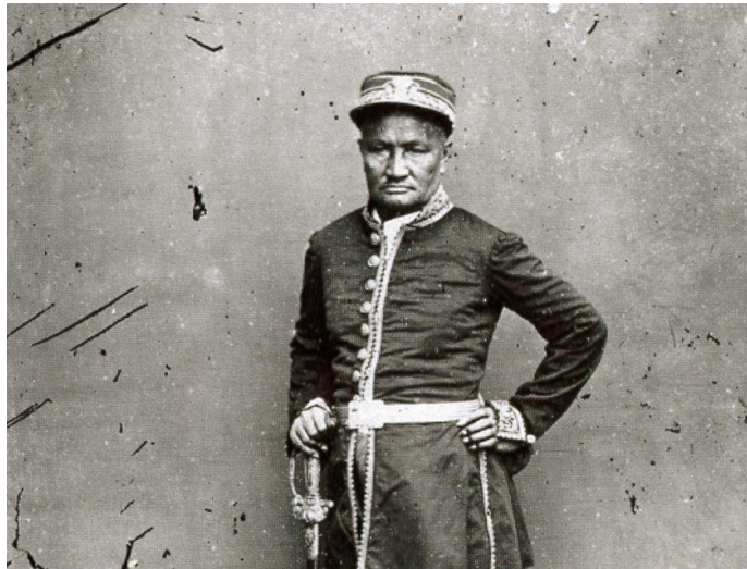
สมเด็จพระยาบรมมหาศรีสุริยวงศ์ (ช่วง บุนนาค)

สถานการณ์ในขณะนั้นถูกซ้ำเติมให้ยุ่งยากขึ้นเมื่อรัชกาลที่ 4 มีพระราชปรารภให้ขุนนางชั้นผู้ใหญ่ประชุมปรึกษาหารือกันคัดเลือกผู้ที่เหมาะสมให้ขึ้นเป็นพระเจ้าแผ่นดินองค์ต่อไป แต่สถานภาพและอำนาจหน้าที่ของเจ้าพระยาศรีสุริยวงศ์เมื่อรัชกาลที่ 4 เสด็จสวรรคตทำให้ดูประหนึ่งว่าท่านมีอำนาจในการตัดสินใจแต่ผู้เดียว[10]