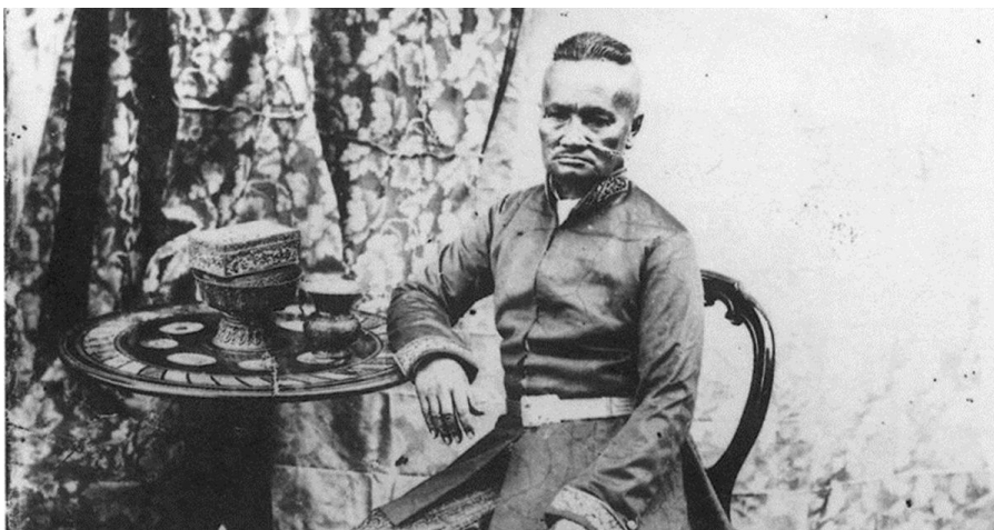
สมเด็จพระเจ้าพระยาบรมมหาศรีสุริยวงศ์ (ช่วง บุนนาค)

ขณะที่รัชกาลที่ 4 กำลังประชวร บ้านเมืองก็เกิดความวุ่นวายพร้อมๆ กันหลายประการ หนึ่งในเรื่องกงสุลอังกฤษไม่พอใจรัฐบาลสยามที่ไม่ปฏิบัติตามหนังสือสัญญา ถึงกับ “ลดธง” เพื่อแสดงเจตนา “ตัดทางพระราชไมตรี” หนึ่งใน คือ เกิดเรื่อง “เงินปลอม” แพร่หลายในการค้าขายของพระนคร จนบรรดาร้านค้าต่างๆ เกิดความกังวลถึงกับจะปิดตลาดไม่ค้าขาย เพื่อแก้ปัญหาเฉพาะหน้า หนึ่งใน คือ เกิดปัญหาโจรผู้ร้ายชุกชุม และพวกอั้งยี่ ฯลฯ ขณะที่ สมเด็จพระเจ้าพระยาบรมมหาศรีสุริยวงศ์ (ช่วง บุนนาค) หรือ “สมเด็จพระเจ้า” เวลานั้น เป็นสมุหกลาโหมต่อจากบิดา และมีรากฐานอำนาจตระกูล “บุนนาค” ที่ญาติพี่น้องเป็นขุนนางตำแหน่งสำคัญมาอย่างต่อเนื่อง