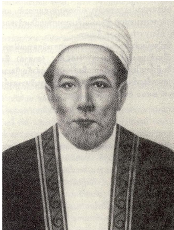
ท่านเอก อะหมัด จุฬาราชมนตรี

ต้นตระกูลบุณนาค คือ เจ้าพระยาบวรราชนายก (เอกอะหมัด) ในยุคสมัยที่ท่านเอกอะหมัดเดินทางเข้ามา กรุงศรีอยุธยา นั้น เป็นปลายแผ่นดินสมเด็จพระนเรศวรมหาราช เอกอะหมัดและบริวารได้เข้ามายังกรุงศรีอยุธยา ตั้งบ้านเรือนและห้างร้านค้าขาย อยู่ที่ตำบลท่ากายี ท่านค้าขายจนกระทั่งมีฐานะเป็นเศรษฐีใหญ่ในกรุงศรีอยุธยา