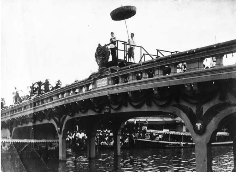
พระบาทสมเด็จพระมงกุฎเกล้าเจ้าอยู่หัว รัชกาลที่ ๖ เสด็จพระราชดำเนิน ทรงเปิดสะพานเจริญพาศน์ ๓๓ ในวโรกาสที่ทรงมีพระชนมพรรษา ๓๓ พรรษา

ทุกวันนี้ สะพานเจริญพาศน์ก็เช่นกัน ถูกรี้อปรับปรุงมาแล้ว ๓ ครั้ง จนไม่มีเค้าของเดิมเหลืออยู่เลย ที่เหลืออยู่เพียงแค่อี้อสะพาน เท่านั้น