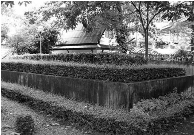
หลุมหลบภัย หน้าโรงเรียนศึกษานารี ที่แปรสภาพกลายเป็น ที่ปลูกต้นไม้ไปแล้ว

หลุมหลบภัยอย่างเดียวกันนี้มีอีกแห่งหนึ่งหน้าโรงเรียนศึกษานารี ย่านวงเวียนเล็ก ยังคงเหลืออยู่เป็นอนุสรณ์แห่งสงคราม แต่ก็จมดินไปครึ่งหนึ่ง บนหลังคาหลุมหลบภัยดัดแปลงมาปลูกไม้ดอก หลุมหลบภัยที่สวยงามที่สุดเป็นหลุมหลบภัยหน้าสถานีรถไฟหัวลำโพง ที่ตรงนี้เดิมทำเป็นอาคารกลมอย่างลูกโลกเพียงครึ่งเดียว ด้านบนมีข้างสามเศียรหล่อด้วยโลหะสำริดประดับอยู่ เมื่อเกิดสงครามได้ดัดแปลงอาคารกลมนี้เป็นหลุมหลบภัย มีชื่อป้าย