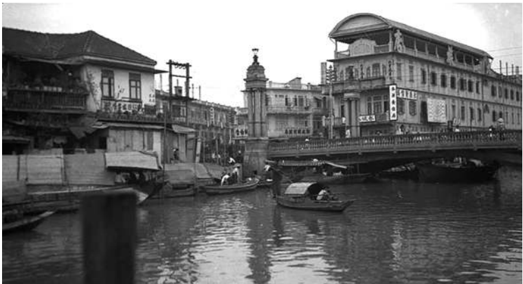
สะพานเจริญสวัสดิ์ ๓๖ เป็นหนึ่งในสะพานชุดเจริญที่สร้างขึ้นในสมัยรัชกาลที่ ๖ (ภาพ : เพจ 77PPP)

เหลืออยู่ในสภาพเดิม บางสะพานถูกทุบทำลายทิ้งสร้างใหม่ ผิดรูป ผิดร่างไปเลย เช่น สะพานเจริญสวัสดิ์ที่ข้ามคลองผดุงกรุงเกษม ตรงสถานีรถไฟหัวลำโพง เป็นสะพานที่สร้างสวยงาม ข้างสะพาน ทำเป็นรูปดอกไม้ ใบไม้ หล่อด้วยแผ่นโลหะอย่างประณีต เช่นเดียวกับสะพานผ่านฟ้า เมื่อสำนักกรุงเทพมหานครได้ขยายสะพาน และปรับปรุงถนนพระราม ๔ กับถนนเลียบบคลองผดุงกรุงเกษม ต้องสร้างสะพานคอนกรีตควบคู่กันไปกับสะพานเจริญสวัสดิ์ ทำให้เกิดความแตกต่างระหว่างของเก่ากับของใหม่ แรก ๆ ยังนึกว่าทางราชการจะรักษาสะพานเจริญสวัสดิ์เอาไว้ เพราะเป็นสะพานที่สวยงามไม่แพ้สะพานผ่านฟ้า แต่คงจะเป็นด้วยสะพานทั้ง ๒ มีรูปแบบแตกต่างกันโดยสิ้นเชิง ประกอบกับนิสัยคนไทยเห่อของใหม่ ผู้มีอำนาจในเวลานั้นจึงรื้อสะพานเจริญสวัสดิ์ออกทั้งหมด แล้วสร้างใหม่ให้เหมือนกับสะพานที่สร้างใหม่ควบคู่กันอย่างที่เห็น