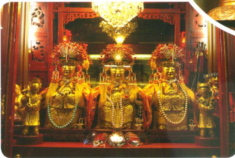
“ช่าในฮูหยิน”

รัตนโกสินทร์ บริเวณริมแม่น้ำเจ้าพระยา แถบท่าดินแดงในปัจจุบัน