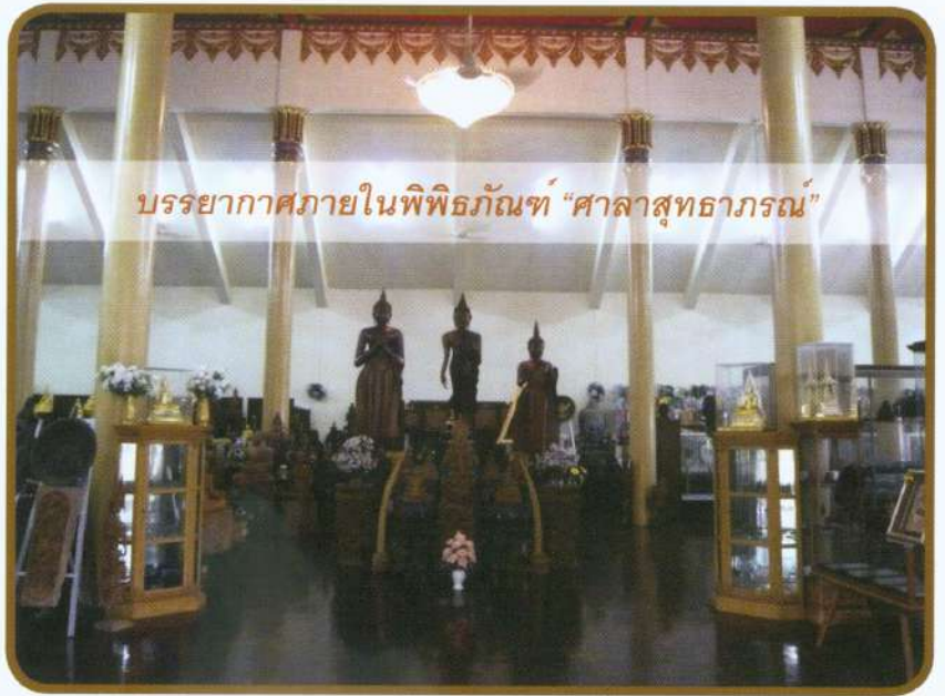
บรรยากาศภายในพิพิธภัณฑ์ "ศาลาสุธาราม"

ก่อสร้างอาคารที่ทำการมูลนิธิฯ อย่างถาวร จัดสร้างศูนย์ล้างไต จัดซื้อเครื่องไตเทียม เพื่อให้บริการแก่ประชาชนตามอัตภาพฐานะ นอกจากนี้ยังเปิดเป็นศูนย์การแพทย์เพื่อให้การรักษาประชาชนใน