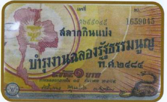
ของเก่าเก็บสะสมในพิพิธภัณฑ์ "ศาลาสุทธาภรณ์"