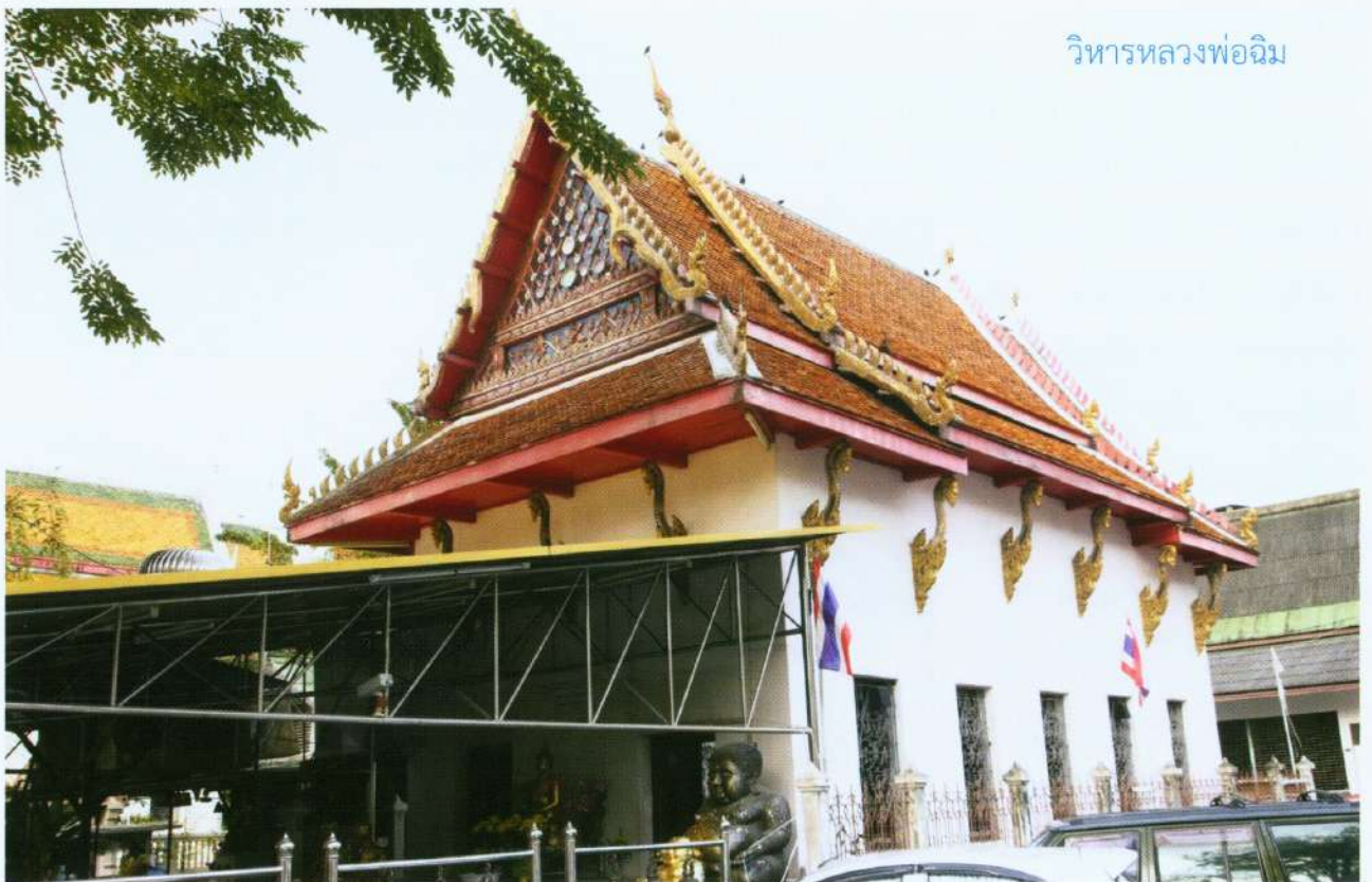
วิหารหลวงพ่อดิม

อุโบสถเป็นอาคารก่ออิฐถือปูนสมัยใหม่ ภายในประดิษฐานพระประธานปางมารวิชัย ส่วนในวิหาร ด้านข้าง มีพระพุทธรูปเก่าแก่ไม่ปรากฏว่าสร้างหรืออัญเชิญมาจากที่ใด แต่เป็นที่นับถือของประชาชนโดยทั่วไป เรียกกันว่า “หลวงพ่อดิม” โดยเฉพาะชาวจีนนิยมมากกราบสักการะขอพร และจุดประทัดถวายอยู่เสมอ