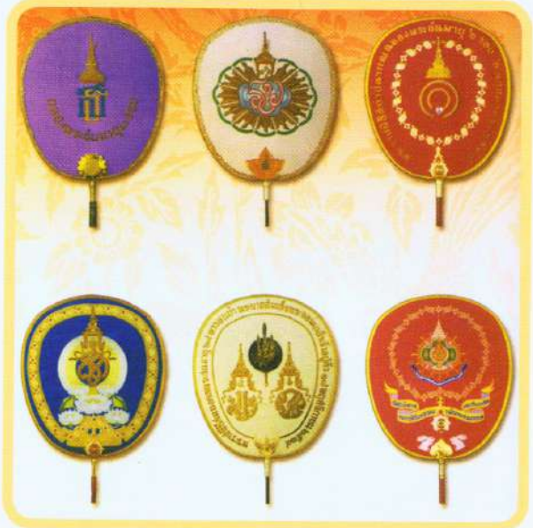
(ขวา) ตาลปัตร พัดรอง ในงานพระราชพิธีต่าง ๆ