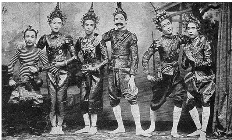
คณะลิเกทรงเครื่อง แต่งองค์ทรงเครื่องอย่างละครรำ

เพชรหลายขนาด เชื่อมต่อกันเป็นแผงใหญ่ประดับหน้าอกแทน ปลายบ่า ๒ ข้างประดับด้วยหัวพญานาคเล็ก ๆ แทนอินทรีนุ อย่างละคร มีสายสะพายเป็นผ้าแพรสีแดงหรือสีอื่น สะพายจาก บ่าซ้ายไปขวา สวมไว้ที่สะโพก สายสะพายอยู่ใต้สังวาลแผงอก ศีรษะยังสวมชฎาหรือปิ่นจุเหรีจ เครื่องประดับทุกอย่างทำด้วยเงิน ประดับพลอยเทียม