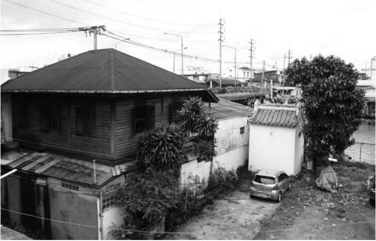
มุมมองจากชั้น ๒ เห็นคลองบางหลวงและสะพานเจริญพาศน์

เล็กกว่าหลังคาด้านล่าง ส่วนของหลังคาที่ซ้อนกันอยู่ทำเป็นช่องระบายอากาศแทนช่องลม มีบานสังกะสีปิดเปิดได้ด้วยสายชักที่เป็นเชือก ภายในโรงมีเวทีการแสดงและที่นั่งสำหรับคนดูอย่างโรงมหรสพทั่วไป กรอบเวทีด้านบนมีป้ายบอกชื่อคณะ ที่จำได้เขียนรูปรามสูรกับนางเมขลาไว้คนละข้าง ตรงกลางเป็นชื่อคณะ ศรีจันทร์ เป็นคณะละครร้อง วิกตลาดยิ่งยืนนอกจากแสดงละครร้องแล้ว ยังแสดงลิเก โขนสด ไม่เคยเห็นฉายภาพยนตร์