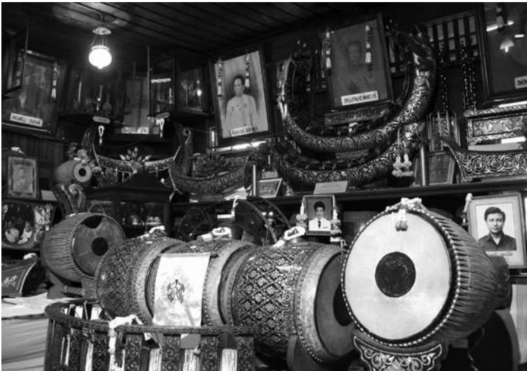
บ้านเครื่องของพาทย์โกศล ครูดนตรีแห่งสำนักฝั่งธนฯ ซึ่งตัวเรือนตั้งอยู่หลังวัดกัลยาณมิตร (ภาพ : ศูนย์ข้อมูลเล็ก-ประไพ วิริยะพันธุ์)

พาศน์ เชียงสะพานเจริญพาศน์อีกฝั่งหนึ่งเป็นบ้านพระยาสกุล บุญนาค ตั้งแต่เชียงสะพานไปจนถึงปากคลองวัดบุญปารามหรือ คลองวัดดอกไม้ เริ่มตั้งแต่บ้าน คุณหญิงอายุยืน คุณหญิงภรรยา ของนาวาเอก พระยาอรสูมพลาภิบาล (เด่น บุญนาค) และคงมี การแบ่งปันกันในหมู่ทายาท บางส่วนเป็นโรงย้อมผ้า ยังมี ตรอก โรงคราม อยู่ในที่ดินผืนนี้ ที่ดินผืนนี้ทั้งหมดเดิมเป็นบ้านพระยา ราชานุประพันธ์ (หุ้ย) บางส่วนเป็นบ้านพระยาราชานุประพันธ์ (สุดใจ) ต่อจากกลุ่มบ้านสกุลบุญนาคตรงนี้แล้วเป็นมัสยิดเรียก กันว่า กุฎีขาว จนถึงบ้านปรมาจารย์ดนตรีไทยคือบ้าน จางวางทั่ว พาทย์โกศล อยู่เชียงสะพานสร้างใหม่ข้ามคลองบางหลวง มีถนน