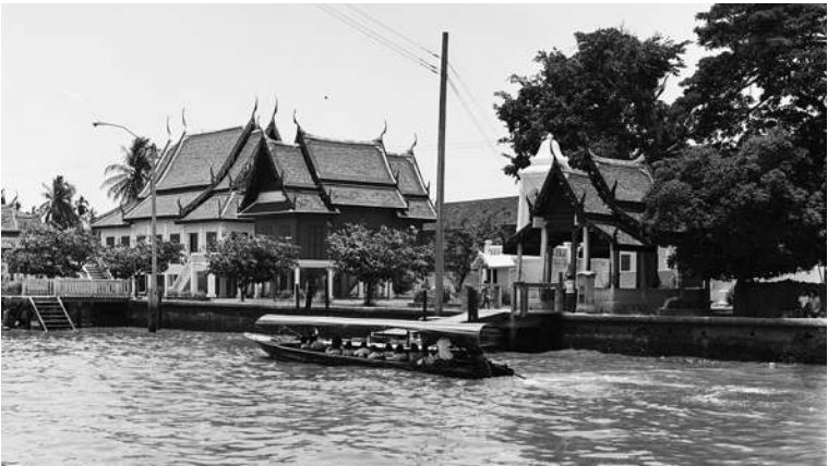
วัดสังข์กระจายริมคลองบางหลวง

วัดสังข์กระจายมีคลองเล็ก ๆ คั่นอยู่คลองหนึ่งคือ คลอง วัดสังข์กระจาย เลยปากคลองวัดสังข์กระจายไปเล็กน้อยเป็น บ้านคุณพิณ นามเต็มของท่านคือ พิณเทพเฉลิม เป็นบุตรพระยา