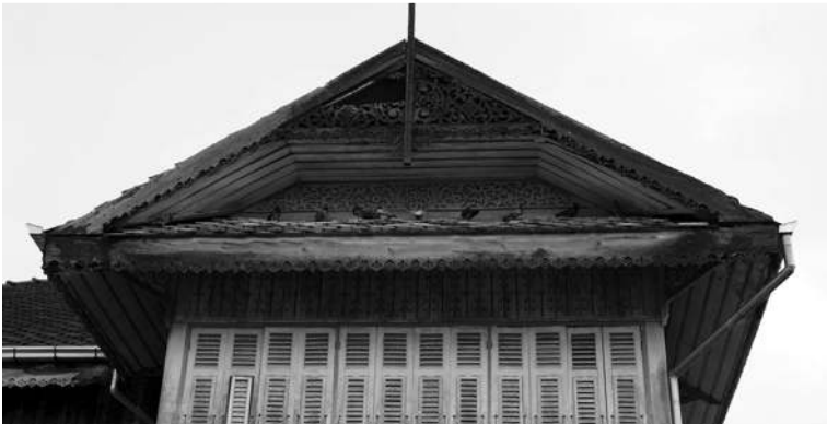
บ้านสับน้อยหรือบ้านพระยากสิภูมิ (น้อย แสงมณี) น้องชายของหลวงฤทธิณรงค์รอน