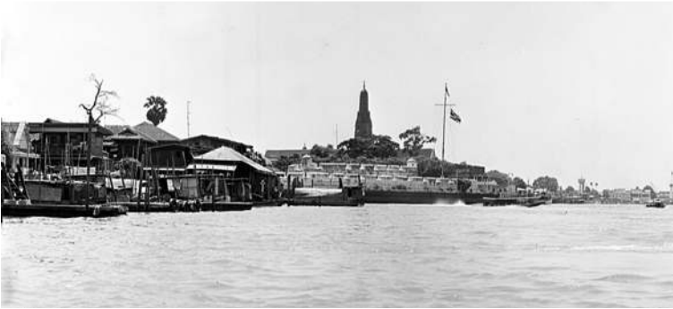
ป้อมวิไชยประสิทธิ์บริเวณปากคลองบางหลวง ฝั่งตรงข้ามเป็นชุมชนวัดกัลยาณ์ บันทึกภาพเมื่อ พ.ศ. ๒๕๑๘

ที่จะใช้สอยในราชการ จึงรื้อออกทั้งหมดแล้วสร้างอาคารใหม่ไว้แทน