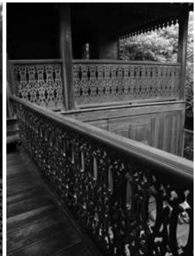
บ้านพระยาภักตินฤเบศร์ (แก้ว ศาลิคุปต) ตั้งอยู่ปากคลองภาษีเจริญ ฝั่งตรงข้ามวัดปากน้ำ ภายใตเงาไม้และราวลูกกรงเหล็กหล่อสวยงาม