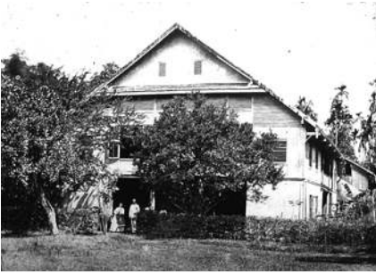
บ้านและโรงพิมพ์หมอบรัดเลย์ ตั้งอยู่ริมคลองบางหลวง ด้านหลังของ ป้อมวิไชยประสิทธิ์