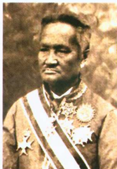
>> สมเด็จพระยาบรมมหา ศรีสุริยวงศ์ (ช่วง บุนนาค)

จะเห็นได้ว่าสมเด็จพระยาบรมมหาศรีสุริยวงศ์ (ช่วง บุนนาค) มีความสนใจเกี่ยวกับเรื่องการคมนาคมขนส่ง มาตั้งแต่ช่วงแรกๆ ของการรับราชการ โดยเฉพาะการต่อเรือ แบบฝรั่ง ซึ่งเป็นกลไกสำคัญของการคมนาคมขนส่ง การขุด คลอง และการสร้างถนน ซึ่งเป็นเครือข่ายของการคมนาคม ขนส่งทั้งทางน้ำและทางบก รวมถึง การสร้างประกาศารเอื้อ ต่อการคมนาคมขนส่งในช่วงปลายของการ รับราชการ ซึ่งการ ดำเนินการของท่านดังกล่าวสะท้อนให้เห็นความรู้ความ สามารถทางด้านช่างของท่าน ความสนใจใฝ่รู้ศึกษาค้นคว้า ด้านช่างแบบตะวันตกซึ่งเป็น “ของใหม่” ในสังคมไทย ขณะนั้น ตลอดจนการเป็นผู้มีวิสัยทัศน์ เห็นการณ์ไกลของท่าน รวมทั้งการดำเนินการที่เป็นประโยชน์ต่อสาธารณชน โดยเสีย สละทรัพย์ของตนเพื่อกิจการสาธารณประโยชน์ ซึ่งมาจาก ความรู้และความคิดของท่าน ซึ่งส่งผลต่อประโยชน์ของประเทศชาติในด้านการคมนาคมขนส่ง และ ยังคงสืบเนื่องต่อมาจนถึงปัจจุบัน