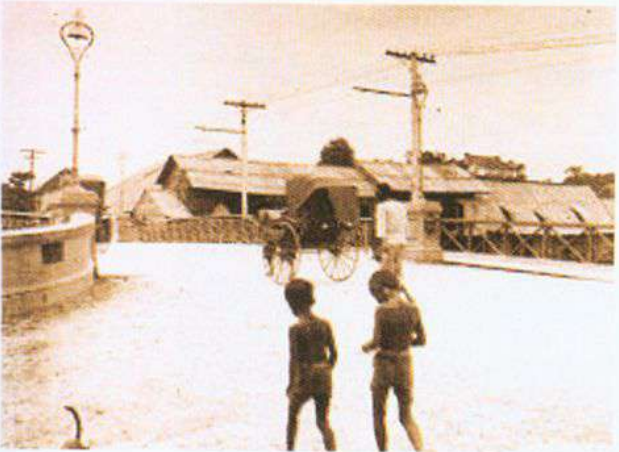
>> สะพานดำรงสถิต (สะพานเหล็กบน) ซึ่งสมเด็จพระยาบรมมหาศรีสุริยวงศ์ สร้างข้ามคลองโอง่าง

ใน พ.ศ. 2404 รัชกาลที่ 4 โปรดเกล้าฯ ให้สมเด็จพระยาบรมมหาศรีสุริยวงศ์ ออกไปเมืองสิงคโปร์ พร้อมกับพระเจ้าลูกยาเธอ กรมหมื่นวิษณุvardนารถนารถ ซึ่งทรงบัญชาการกรมพระคลังมหาสมบัติ โดยมีพระราชประสงค์ให้ตรวจตราพิจารณาศึกษาวิธีที่อังกฤษทำนุบำรุงบ้านเมืองในสิงคโปร์ เพื่อจะได้นำมาปรับปรุงใช้ในบ้านเมืองไทยบ้าง แต่ไม่ปรากฏหลักฐานคำกราบบังคมทูลรายงานของสมเด็จพระยาบรมมหาศรีสุริยวงศ์ เกี่ยวกับการดูงานที่สิงคโปร์หลังจากท่านกลับมาแล้ว อย่างไรก็ตามก็ตีปรากฏว่าหลังจากนั้นได้มีการทำนุบำรุงบ้านเมืองตามแบบอารยประเทศหลายประการ เช่น การจัดการคมนาคม และการก่อสร้าง ซึ่งสมเด็จพระยาบรมมหาศรีสุริยวงศ์ ได้เข้าไปมีบทบาทดำเนินการเป็นส่วนใหญ่ เช่น การตัดถนนเจริญกรุง พร้อมกับการขุดคลองควบคู่ไปกับการตัดถนน สมเด็จพระยาบรมมหาศรีสุริยวงศ์ ยังได้ออกเงินส่วนตัวสร้างสะพานดำรงสถิต และสะพานพิทยเสถียรข้ามคลองที่ขุดใหม่บนถนนดังกล่าวด้วย