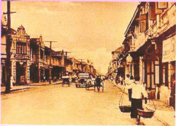
>> ถนนเจริญกรุง