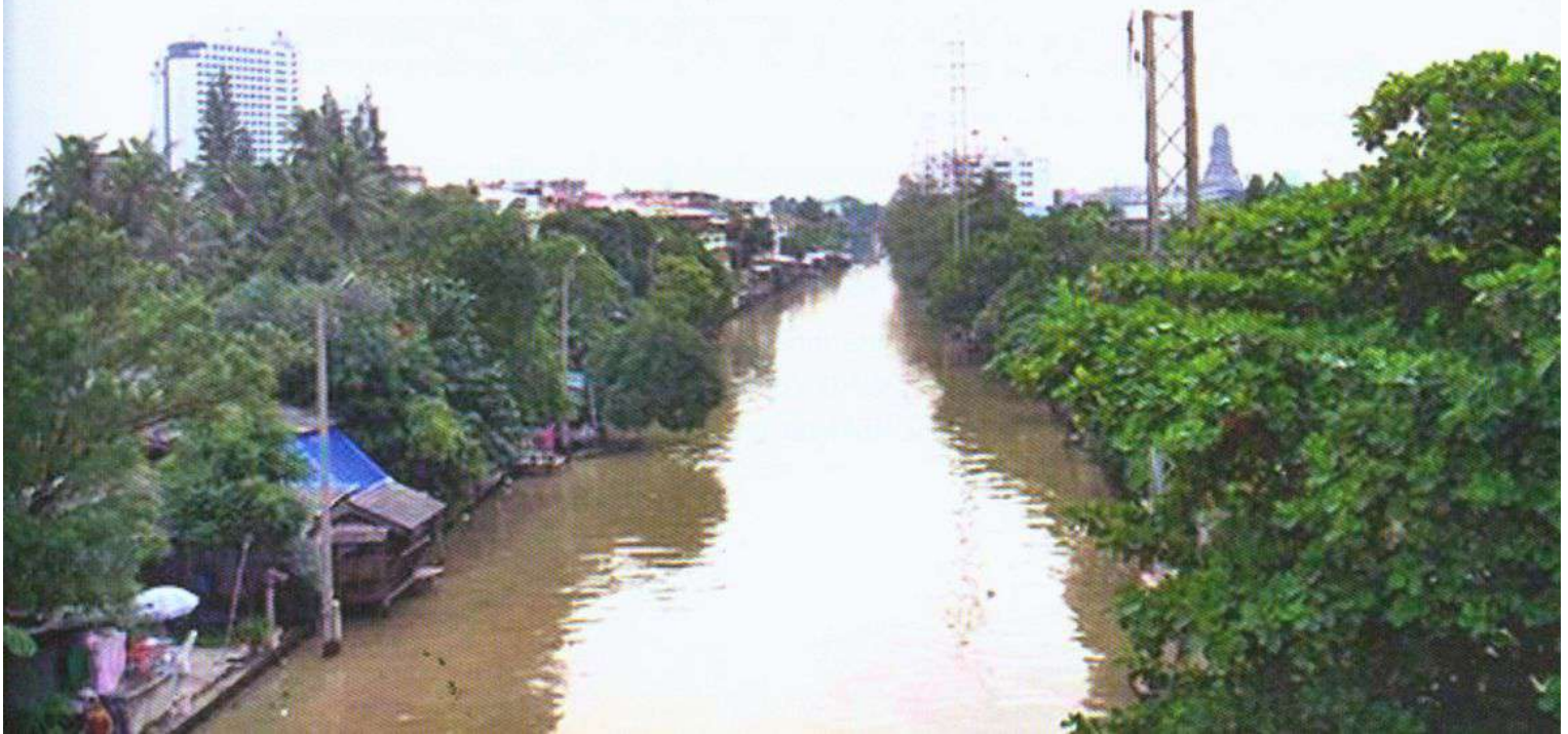
>> คลองภาษีเจริญ

ใน พ.ศ. 2404 รัชกาลที่ 4 โปรดเกล้าฯ ให้สมเด็จพระยาบรมมหาศรีสุริยวงศ์ ออกไปเมืองสิงคโปร์ พร้อมกับพระเจ้าลูกยาเธอ กรมหมื่นวิษณุvardนารถนารถ ซึ่งทรงบัญชาการกรมพระคลังมหาสมบัติ โดยมีพระราชประสงค์ให้ตรวจตราพิจารณาศึกษาวิธีที่อังกฤษทำนุบำรุงบ้านเมืองในสิงคโปร์ เพื่อจะได้นำมาปรับปรุงใช้ในบ้านเมืองไทยบ้าง แต่ไม่ปรากฏหลักฐานคำกราบบังคมทูลรายงานของสมเด็จพระยาบรมมหาศรีสุริยวงศ์ เกี่ยวกับการดูงานที่สิงคโปร์หลังจากท่านกลับมาแล้ว อย่างไรก็ตามก็ตีปรากฏว่าหลังจากนั้นได้มีการทำนุบำรุงบ้านเมืองตามแบบอารยประเทศหลายประการ เช่น การจัดการคมนาคม และการก่อสร้าง ซึ่งสมเด็จพระยาบรมมหาศรีสุริยวงศ์ ได้เข้าไปมีบทบาทดำเนินการเป็นส่วนใหญ่ เช่น การตัดถนนเจริญกรุง พร้อมกับการขุดคลองควบคู่ไปกับการตัดถนน สมเด็จพระยาบรมมหาศรีสุริยวงศ์ ยังได้ออกเงินส่วนตัวสร้างสะพานดำรงสถิต และสะพานพิทยเสถียรข้ามคลองที่ขุดใหม่บนถนนดังกล่าวด้วย