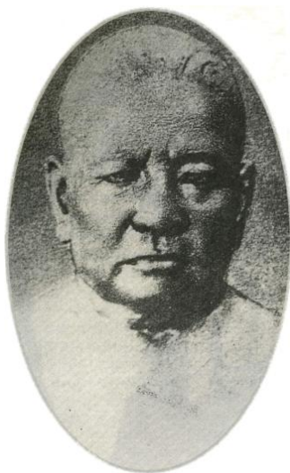
เจ้าพระยาพระคลัง ต่อมาคือสมเด็จพระเจ้าพระยาบรมมหาประยูรวงศ์ (ดิศ บุนนาค) ผู้บิดา

ความคุ้นเคยกับกรมหมื่นเจษฎาบดินทร์ซึ่งอยู่ในรุ่นเดียวกัน การที่เป็นเช่นนี้ เป็นเพราะพระราชดำริของรัชกาลที่ 2 ที่โปรดเกล้าฯให้เสนาบดีตระกูลขุนนางทั้งสอง ได้ทำงานร่วมกับพระราชโอรสทั้งสองของพระองค์ ซึ่งในเวลาต่อมาทั้งกรมหมื่นเจษฎาบดินทร์ และเจ้าฟ้ามงกุฎต่างทรงได้รับการอัญเชิญให้ขึ้นเป็นกษัตริย์ รัชกาลที่ 3 และรัชกาลที่ 4 ตามลำดับด้วยการสนับสนุนอย่างเต็มที่ของเจ้าพระยาพระคลังและสมเด็จพระเจ้าพระยาฯ ทั้งสองท่านเป็นกำลังสำคัญของรัชกาลที่ 3 และรัชกาลที่ 4 ในการบริหารบ้านเมือง