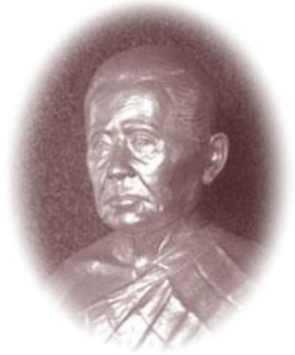
เจ้าคุณราชพันธุฉาน

การเรียนรู้ต่อมาของสมเด็จพระเจ้าพระยาฯ น่าจะเป็นการเรียนรู้เกี่ยวกับฐานะของท่านในสังคม กล่าวคือ เมื่อสมเด็จพระเจ้าพระยาฯ ได้รับการเรียนรู้ในระยะแรกว่า ท่านจะเป็นผู้นำของครอบครัวคน