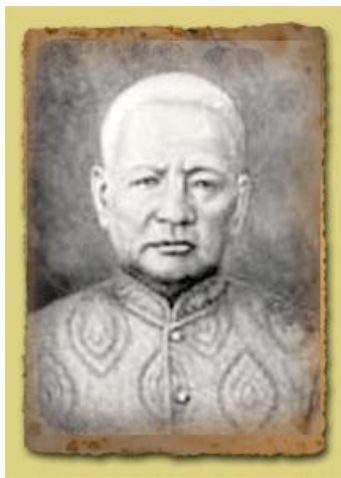
สมเด็จพระยาบรมมหาประยูรวงศ์ (ดิส นุนาค)

เหมาะสมกับสภาพการณ์ในสมัยรัชกาลที่ 1 มาก ได้ดำรงตำแหน่งสมุหพระกลาโหม อัครมหาเสนาบดีฝ่ายทหาร เป็นตำแหน่งสุดท้าย ก่อนถึงอสัญกรรม ใน พ.ศ. 2348 (ก่อนสมเด็จพระเจ้าพระยาฯ เกิดเพียง 3 ปี) ส่วน บิดาของสมเด็จพระเจ้าพระยาฯ ขณะที่ท่านเกิดได้ดำรงตำแหน่งหมื่นไวยวรนาถ หัวหมื่นมหาดเล็ก หัวหน้าของกลุ่มทหารมหาดเล็กของพระมหากษัตริย์ นับว่าเป็นตำแหน่งที่มีความสำคัญมากตำแหน่งหนึ่ง เพราะเป็นตำแหน่งที่มีความใกล้ชิดกับพระเจ้าแผ่นดิน ต่อมาเมื่อสมเด็จพระเจ้าพระยาฯ เจริญวัยขึ้น ในสมัยรัชกาลที่ 2 บิดาของท่านก็มีความเจริญก้าวหน้าในหน้าที่ราชการ โดยได้รับตำแหน่งเลื่อนขึ้นเป็นพระยาสุริยวงค์มนตรี จางวางมหาดเล็กและเจ้าพระยาพระคลัง ตามลำดับ ทั้งนี้ โดยที่บิดาของท่านไม่ได้ใช้คุณสมบัติของความเป็นนักรบเป็นบันไดไต่เต้าสู่ความเจริญในหน้าที่การงานเลย ซึ่งอาจเป็นเพราะว่าในช่วงนั้นบ้านเมืองกำลังอยู่ในภาวะปกติสุขก็เป็นได้ แม้ว่าต่อมาในสมัยรัชกาลที่ 3