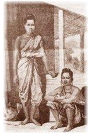
สมเด็จพระอมรินทราบรมราชินี

ต่อไป ท่านก็จะได้รับการฝึกฝนอบรมทางด้านการศึกษาและการดำเนินชีวิต เพื่อเตรียมรับสภาพการเป็นผู้นำในอนาคต โดยมีบิดาเป็นแบบอย่าง ในขณะเดียวกัน เมื่อท่านเจริญวัยขึ้น ท่านได้เรียนรู้ว่าครอบครัวของท่านไม่เพียงแต่เป็นครอบครัวใหญ่แบบครอบครัวขุนนางไทยทั่วไปเท่านั้น แต่เป็นครอบครัวที่มีประวัติความเป็นมาตั้งแต่สมัยอยุธยาตอนกลาง 7 ในสมัยรัตนโกสินทร์ก็มีความสัมพันธ์ใกล้ชิดกับพระราชวงศ์ ซึ่งปกครองประเทศตั้งแต่เริ่มแรก โดยเริ่มตั้งแต่เจ้าพระยา