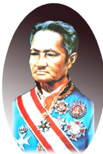
สมเด็จพระเจ้าพระยาบรมมหาศรีสุริยวงศ์ (ช่วง บุนนาค) ผู้บุตรคนโต

ปรากฏการณ์ทางการเมืองเช่นนี้นับว่าน่าสนใจ เพราะเหตุการณ์และสภาพการณ์ทางการเมืองเป็นไปอย่างคล่องจอง เหมาะสม ราวกับมีแผนการมาก่อนทั้งๆที่ไม่มีใครทราบอย่างแน่นอนว่าระหว่างกรมหมื่นเจษฎาบดินทร์กับเจ้าฟ้ามงกุฎ พระองค์ใดจะได้ขึ้นสืบราชสมบัติต่อจากรัชกาลที่ 2 เพราะต่างก็ทรงมีความเหมาะสมที่จะเป็นพระมหากษัตริย์ด้วยกันทั้งสองพระองค์ และรัชกาลที่ 2 ไม่ได้ตรัสมอบราชสมบัติให้แก่พระองค์ใดด้วย ไม่ปรากฏหลักฐานว่ารัชกาลที่ 2 ทรงคิดอย่างไรเกี่ยวกับเรื่องนี้ แต่การกระทำของพระองค์ได้กลายเป็นผลทางการเมืองที่สำคัญต่อมา อาจเป็นไปได้ว่ารัชกาลที่ 2 ซึ่งทรงโปรดปรานและอุปถัมภ์พวกลูกหลานของเจ้าคุณนวลและเจ้าพระยาอรรคมหาเสนาอยู่แล้ว คงทรงต้องการสนับสนุนให้ได้ปฏิบัติราชการใกล้ชิดกับพระราชโอรส ซึ่งพระองค์โปรดปรานเป็นพิเศษ และเป็นผู้ที่มีโอกาสจะได้เป็นเจ้าแผ่นดินเหนือเจ้านายพระองค์อื่นๆโดยอาจทรงคำนึงถึงวัยที่ใกล้เคียงกัน อันจะมีส่วนช่วยให้ความคิดเห็นไม่ต่างกันนัก ซึ่งพอดีกับที่เจ้าพระยาพระคลังมีวัยใกล้เคียงกับกรมหมื่นเจษฎาบดินทร์ 14 และสมเด็จพระเจ้าพระยาฯอยู่ในรุ่นเดียวกับเจ้าฟ้ามงกุฎ