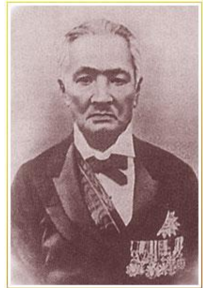
สมเด็จพระยาบรมมหาศรีสุริยวงศ์ (ช่วง บุนนาค)

ขั้นที่ 1 เป็นขั้นเรียนรู้มูลฐานของมนุษย์ เด็กๆ เมื่อเกิดจากครรภ์มารดา ก็จะได้รับการศึกษาอบรม การเรียนรู้ต่างๆ เกี่ยวกับวัฒนธรรมความเชื่อ ความถูกต้องในการกระทำต่างๆ การแสดงออกซึ่งความรู้ความเข้าใจในหลักการต่างๆ โดยมีบิดามารดา ปู่ย่า ตายาย หรือสมาชิกอื่นๆ ในครอบครัวเป็นผู้สอนหรือฝึกอบรม เพื่อให้จะให้เด็กนั้นๆ ได้เป็นสมาชิกของสังคมต่อไป เด็กจะได้รับการสั่งสอนอบรมในค่านิยมและทัศนคติ ความชำนาญชาญหรือทักษะ ตลอดจนความสัมพันธ์ในบทบาทต่างๆ ซึ่งสมาชิกใน