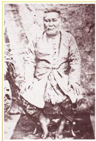
เจ้าพระยาทิพากรวงศ์มหาโกษาธิบดี (เจ้า บุนนาค)

(ท่านเกิดใน พ.ศ.2356) และมีรสนิยมใกล้เคียงกัน ปรากฏว่าต่อมาท่านทั้งสองได้ร่วมกันรับใช้ ช่วยเหลือบิดาในกิจการทั้งปวง ตั้งแต่เริ่มรับราชการ 6 และได้มาเป็นคู่คิดร่วมมือกัน มีบทบาททางการเมืองหลายครั้ง โดยเฉพาะในสมัยรัชกาลที่ 3 และรัชกาลที่ 4