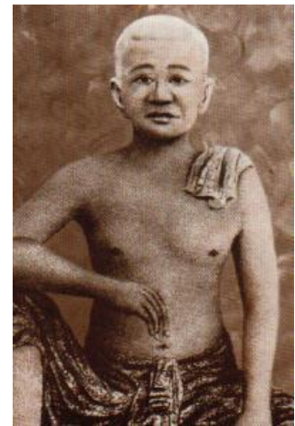
เจ้าพระยาบดินทรเดชา (สิงห์ สิงหเสนี)

ในด้านการฝึกฝน อบรม และการเรียนรู้จากครอบครัว ซึ่งสมเด็จพระเจ้าพระยาฯ ได้รับการถ่ายทอดกระบวนการเรียนรู้เป็นเบื้องต้น น่าจะเกี่ยวกับการตระหนักถึงฐานะของท่านในครอบครัว กล่าวคือครอบครัวของสมเด็จพระเจ้าพระยาฯ เป็นครอบครัวใหญ่ซึ่งมีบิดาเป็นผู้นำ บิดามีภริยาหลายสิบคน มีบุตรธิดารวมทั้งสิ้น 61 คน เป็นชาย 30 คนหญิง 31 คน 3 สมเด็จพระเจ้าพระยาฯ เป็นบุตรชายคนโตเกิดจากท่านจันทร์ภริยาเอกซึ่งมีฐานะเป็นท่านผู้หญิง โดยนัยนี้ ท่านน่าจะได้รับการ