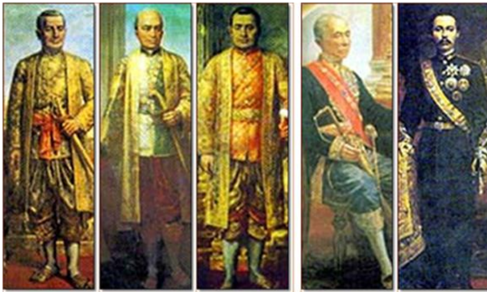
พระมหากษัตริย์ในราชวงศ์จักรี รัชกาลที่ 1 – รัชกาลที่ 5

การเรียนรู้ในชั้นนี้ น่าจะทำให้สมเด็จพระเจ้าพระยาฯ ตระหนักดีว่าฐานะ ชาติกำเนิดและสกุลวงศ์ เป็นเงื่อนไขสำคัญอย่างยิ่งในการปฏิบัติราชการของบุคคล ที่จะก้าวไปสู่ตำแหน่งหน้าที่การงานชั้นสูงต่อไป ดังกรณีบิดาของท่านและตัวท่านเองซึ่งได้รับการยอมรับนับถือจากคนทั่วไปในฐานะบุตรชายคนโต ซึ่งจะเป็นผู้สืบตระกูลของบิดา สำนึกดังกล่าว ก่อเกิดบุคลิกแห่งความเป็นผู้นำทั้งในระดับครอบครัวและระดับสังคมให้แก่สมเด็จพระเจ้าพระยาฯ นอกจากนี้ อาจกล่าวได้ว่าการเรียนรู้ในชั้นแรกและชั้นที่สองนี้ น่าจะทำให้สมเด็จพระเจ้าพระยาฯ มีทัศนคติในเรื่องความสำคัญของ “ระบบพวกพ้องและเครือญาติ” เบื้องต้นด้วย กระบวนการเรียนรู้แบบเดียวกันนี้ น่าจะไม่ต่างไปจากบุตรคนโตของขุนนางตระกูลอื่นๆ เช่น นุช บุญยรัตพันธุ์ ซึ่งเกิดเป็นสหชาติกับท่านและเป็นทายาทคนโตของเจ้าพระยาอภัยภูธร (น้อย) ที่สมุหนายก ต่อมาในสมัยรัชกาลที่ 4 ได้เป็นเจ้าพระยาภูธราภัยที่สมุหนายกคู่กับสมเด็จพระเจ้าพระยาฯ ซึ่งเป็นที่สมุหพระกลาโหม ทั้งสองท่านมีความสัมพันธ์ในระบบเครือญาติกันด้วยดังจะกล่าวในภายหลัง ข้อที่น่าสังเกต คือ มีขุนนางเพียงไม่กี่ตระกูลที่ปรากฏทายาทผู้สืบตระกูลถึงชั้นเจ้าพระยา ติดต่อกันเนื่องกันตั้งแต่สมัยรัชกาลที่ 1 ถึงสมัยรัชกาลที่ 4 ได้แก่ตระกูลสิงหนเสนี บุญยรัตพันธุ์ สนธิรัตน์ ณ นคร และบุญนาค ในบรรดาตระกูลเหล่านี้ตระกูลบุญนาค เจริญเติบโตอย่างเต็มที่มาตั้งแต่ต้นสมัยรัชกาลที่ 5 9