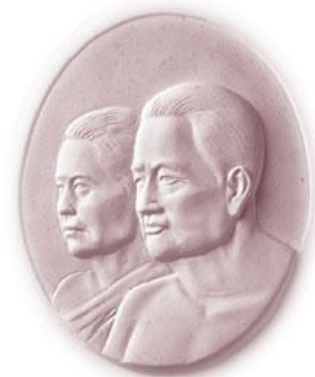
เจ้าพระยาอรรคมหาเสนา (บุนนาค) และเจ้าคุณราชพันธุ์นวล

ประเด็นนี้ อาจนำมาใช้ศึกษาเกี่ยวกับตัวสมเด็จพระยาฯ ได้ กล่าวคือ ท่านเกิดและเจริญวัยมาในช่วงเวลาดังกล่าว ในตระกูลของชนชั้นปกครอง ต้นตระกูลของท่านในสมัยรัตนโกสินทร์ คือ เจ้าพระยาอรรคมหาเสนา (บุนนาค) ซึ่งเป็นปู่ของท่าน มีคุณสมบัติของความเป็นนักรบอันนับว่า