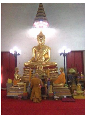
พระพุทธรูปใน โบสถ์วัดใหญ่ศรีสุพรรณ

ประวัติของชุมชนรอบสถาบันราชภัฏบ้านสมเด็จเจ้าพระยา มีความเกี่ยวข้องกับสังคมไทยในสมัยกรุงศรีอยุธยาครั้งที่ 2 จนถึงสมัยกรุงรัตนโกสินทร์ตอนต้นอยู่มาก พื้นที่รอบสถาบันแห่งนี้จึงมีบทบาทสำคัญในการเชื่อมโยงเหตุการณ์ที่เกิดขึ้นแก่สังคมไทยในอดีต