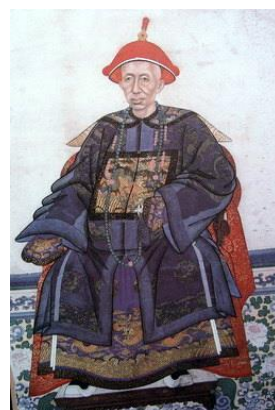
พระบรมฉายาลักษณ์พระบาทสมเด็จพระจอมเกล้าเจ้าอยู่หัวในฉลองพระองค์แบบจีน