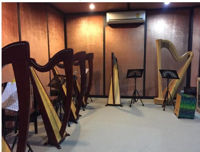
ห้องฮาร์ป