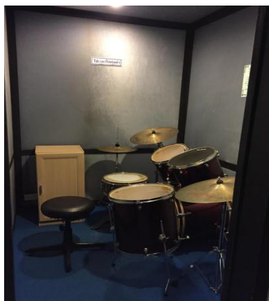
ห้องกลองชุด