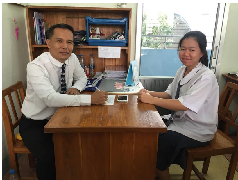
ภาพ สัมภาษณ์นักเรียนชั้นมัธยมศึกษาปีที่ 6