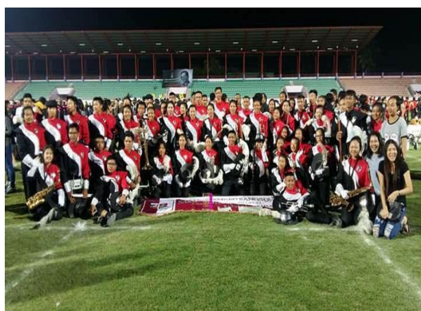
ภาพการถ่ายภาพ