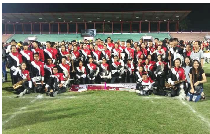
ภาพที่ 5 วงโยธวาทิต

กิจกรรมพัฒนาผู้เรียนที่เพิ่มทักษะอีกด้านหนึ่งนอกเหนือจากทักษะของการปฏิบัติเครื่องดนตรีเดี่ยว ฝึกทักษะในการรวมวงโดยใช้บทเพลงที่แตกต่างจากการเรียนเดี่ยว เพิ่มศักยภาพในการบรรเลงร่วมกับผู้อื่น รับผิดชอบหน้าที่และมีทักษะในการบรรเลงรวมวงในแบบต่างๆ ซึ่งนักเรียนทุกคนจะต้องเป็นสมาชิกของวงดนตรีของโรงเรียนอย่างน้อย 1 วง โดยครูแต่ละวิชาเป็นผู้กำหนดนักเรียนในด้านการรวมวงและลักษณะเครื่องดนตรีต่างๆ วงดนตรีต่างๆจะออกแสดงในงานต่างๆทั้งภายในโรงเรียนและภายนอกโรงเรียน แบ่งออกเป็น 6 วง ได้แก่ วงโยธวาทิต วงชมเบอร์ออร์เคสตรา วงขับร้องประสานเสียง วงซิมโฟนี ออร์เคสตรา วงบิกแบนด์ วงปี่สกอต