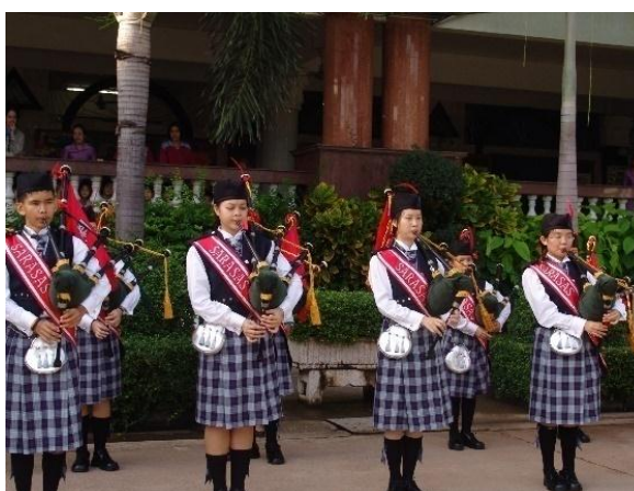
ภาพที่ 11 วงปี่สกอต

วงปี่สกอต เป็นวงที่ส่งเสริมตามนโยบายโรงเรียนในเครือสารสาสน์เมื่อจบการศึกษาจากโรงเรียนในเครือสารสาสน์ไปแล้วต้องปฏิบัติดนตรีอย่างน้อย 1 ชิ้น ท่านประธานอำนวยการได้มีนโยบายจัดตั้งวงปี่สกอตขึ้นที่โรงเรียนสารสาสน์วิเทศบางบอน โดยการจัดซื้อเครื่องจากประเทศสกอตแลนด์จำนวน 35 เครื่อง และทางบริษัทเครื่องดนตรีมีความสนใจจะมาสอนทักษะและเทคนิคการบรรเลงปี่สกอตให้กับครูและนักเรียนโรงเรียนสารสาสน์วิเทศบางบอน ทางบริษัทมีข้อตกลงว่าโรงเรียนต้องออกค่าเดินทางให้และมีที่พักให้เป็นเวลา 1 เดือน ให้กับครูที่ไปสอน ท่านประธานอำนวยการตอบตกลง จึงได้ครูโดยตรงจากประเทศสกอตแลนด์มาให้ความรู้โดยตรง