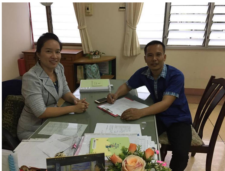
ภาพ สัมภาษณ์ผู้บริหาร