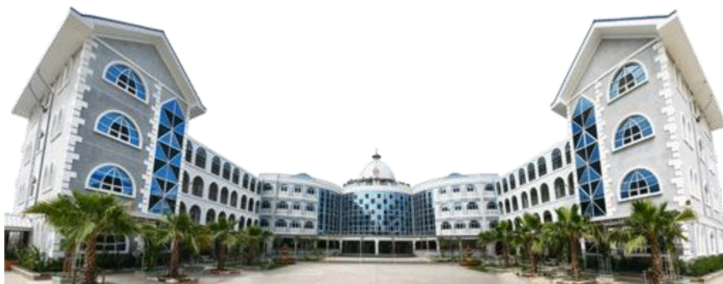
ภาพที่ 1 โรงเรียนสารสาสน์วิเทศบางบอน