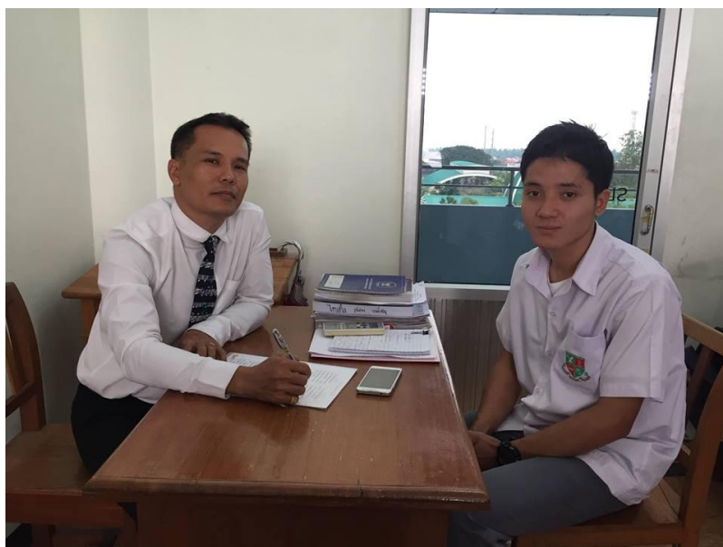
ภาพ สัมภาษณ์นักเรียนชั้นมัธยมศึกษาปีที่ 5