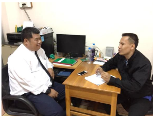
ภาพที่ 3 สัมภาษณ์ครูผู้สอน

ที่ชอบแล้วเข้าพบครู ครูจะดูสรีระให้เหมาะสมกับเครื่องดนตรี เช่น ความสูง นิ้ว แขนสำหรับเครื่องเป่าต้องดูรูปปากและโครงสร้างฟัน นักเรียนจะทดลองปฏิบัติเครื่องดนตรี 1 เดือน ช่วงเปิดเทอมเดือนพฤษภาคม นักเรียนที่มีอุปสรรคในการปฏิบัติเครื่องดนตรีหรือไม่เหมาะสม จะสามารถเปลี่ยนเครื่องดนตรีได้โดยขึ้นอยู่กับพิจารณาของครูผู้สอนประจำเครื่องดนตรีต่างๆ ตามความเหมาะสม