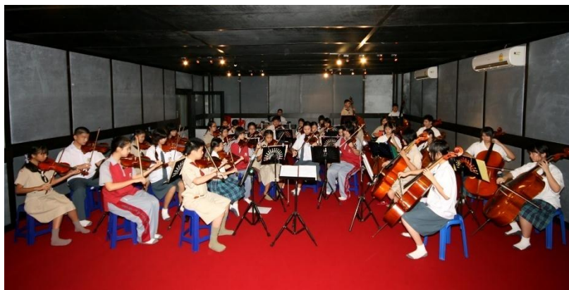
ภาพที่ 8 วงซิมโฟนี ออร์เคสตรา

วงซิมโฟนีออร์เคสตรา เป็นวงที่ส่งเสริมและพัฒนาศักยภาพของนักเรียนที่เรียนวิชาปฏิบัติ ทั้ง 5 ประเภท คือ กลุ่มเครื่องสายสากล กลุ่มเครื่องเป่าลมไม้ กลุ่มเครื่องเป่าลมทองเหลือง กลุ่มเครื่องกระทบ และกลุ่มเครื่องดีมนี้ว ได้มารวมวงและพัฒนาทักษะทั้งด้านการรวมวงและการแสดงดนตรีและการบรรเลงดนตรีประกอบวจนพิธีการแสดงงานเทศกาลดนตรี