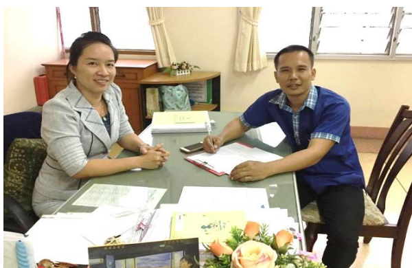
ภาพที่ 2 สัมภาษณ์ผู้บริหาร(ผู้ช่วยผู้อำนวยการ)

การคัดเลือกผู้เรียนเมื่อนักเรียนผ่านสอบคัดเลือกเข้ามาเป็นนักเรียน โครงการพิเศษ นักเรียนจะได้เรียนวิชาพื้นฐานเพื่อปรับพื้นฐานการเรียนช่วงภาคฤดูร้อนช่วงเดือนเมษายน และเรียนวิชาปฏิบัติดนตรีจะได้เลือกเครื่องดนตรีที่นักเรียนสนใจ โดยครูจะเป็นผู้พิจารณาความเหมาะสมในแต่ละเครื่องดนตรี นักเรียนจะได้ทดลองเรียนเครื่องดนตรี 1 เดือน ช่วงเดือนพฤษภาคม นักเรียนสำหรับนักเรียนที่มีอุปสรรคในการปฏิบัติเครื่องดนตรี หรือไม่เหมาะกับเครื่องดนตรีนั้นๆ สามารถเปลี่ยนเครื่องดนตรีได้อีก 1 ครั้ง โดยการพิจารณาของครูผู้สอนตามความเหมาะสม