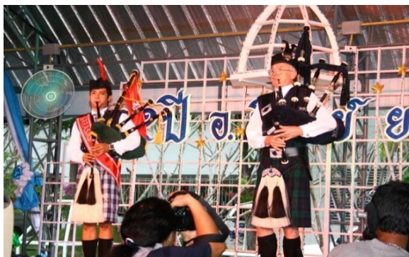
ภาพที่ 10 วิทยากรจากประเทศสกอตแลนด์