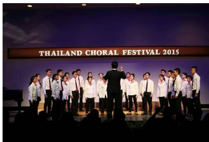
ภาพที่ 7 วงขับร้องประสานเสียง

วงชมเบอร์ออร์เคสตรา เป็นวงพัฒนาผู้เรียนจากการเรียนวิชาปฏิบัติจากวิชาปฏิบัติเครื่องสาย ได้แก่ ไวโอลิน วิโอลา เซลโล ดับเบิลเบส มารวมวงกันเป็นวงเครื่องสายสากลเพื่อพัฒนาด้านการรวมวง และใช้ในการบรรเลงในกิจกรรมต่างๆของโรงเรียน เช่น ประกอบงานพิธีกรรมทางศาสนาในโรงเรียน การแสดงในงานต่างๆ งานประชุมผู้ปกครอง งานวันวิชาการ ฯลฯ