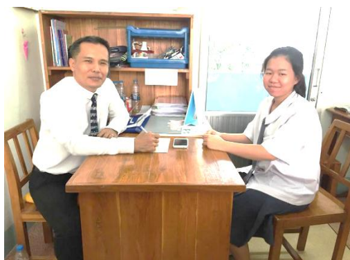
ภาพที่ 4 สัมภาษณ์นักเรียน

การสอบเข้ามารับทุนนั้น โรงเรียนจะมีการสอบวิชาพื้นฐานหลัก 5 วิชา คณิตศาสตร์ ภาษาอังกฤษ วิทยาศาสตร์ ภาษาไทย และสังคม และไม่มีทดสอบความสามารถทางด้านดนตรีในเดือนเมษายน เริ่มเรียนมัธยมศึกษาปีที่ 4 เรียนปรับพื้นฐานภาคฤดูร้อน ครูจะรวมนักเรียนเพื่อแนะนำครูและเครื่องดนตรีแต่ละเครื่องให้รู้ และเลือกเครื่องที่ตนสนใจ โดยครูจะดูสรีระ เช่น ความสูง แขน มือ นิ้ว รูปปาก ฟัน แต่ละคนว่าเหมาะสมหรือไม่กับเครื่องดนตรีที่นักเรียนเลือก และในช่วงเปิดเทอมเดือนพฤษภาคมครูจะให้ให้นักเรียนที่มีอุปสรรคในการปฏิบัติเครื่องดนตรี สามารถเปลี่ยนเครื่องดนตรีได้แล้วเรียนเครื่องนั้นจนจบมัธยมศึกษาปีที่ 6