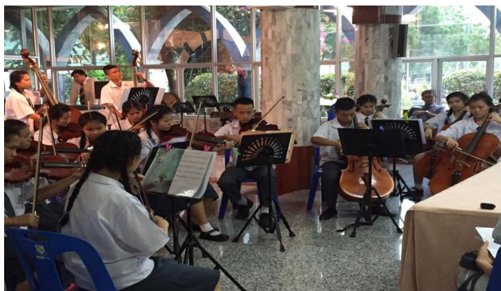
ภาพที่ 6 วงชมเบอร์ออร์เคสตรา

วงชมเบอร์ออร์เคสตรา เป็นวงพัฒนาผู้เรียนจากการเรียนวิชาปฏิบัติจากวิชาปฏิบัติเครื่องสาย ได้แก่ ไวโอลิน วิโอลา เซลโล ดับเบิลเบส มารวมวงกันเป็นวงเครื่องสายสากลเพื่อพัฒนาด้านการรวมวง และใช้ในการบรรเลงในกิจกรรมต่างๆของโรงเรียน เช่น ประกอบงานพิธีกรรมทางศาสนาในโรงเรียน การแสดงในงานต่างๆ งานประชุมผู้ปกครอง งานวันวิชาการ ฯลฯ