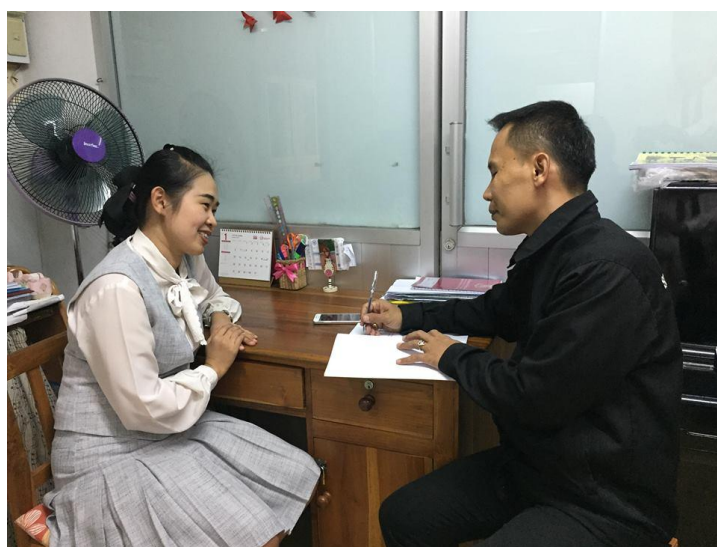
ภาพ สัมภาษณ์ครู