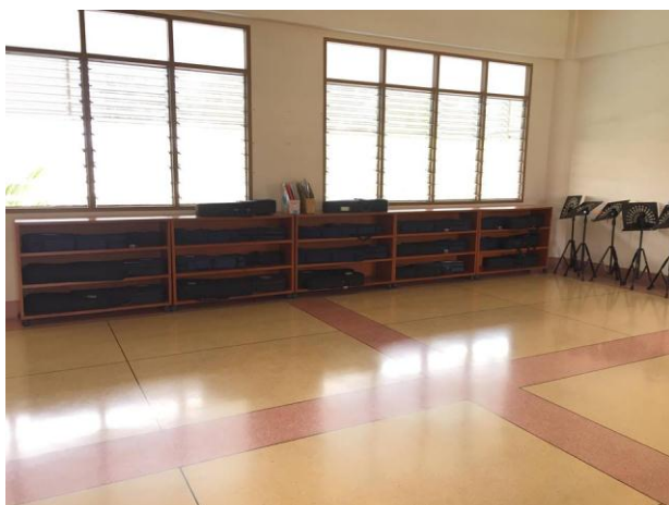
ห้องไวโอลิน