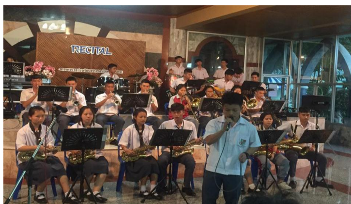
ภาพที่ 9 วงบิกแบนด์

วงซิมโฟนีออร์เคสตรา เป็นวงที่ส่งเสริมและพัฒนาศักยภาพของนักเรียนที่เรียนวิชาปฏิบัติ ทั้ง 5 ประเภท คือ กลุ่มเครื่องสายสากล กลุ่มเครื่องเป่าลมไม้ กลุ่มเครื่องเป่าลมทองเหลือง กลุ่มเครื่องกระทบ และกลุ่มเครื่องดีมนี้ว ได้มารวมวงและพัฒนาทักษะทั้งด้านการรวมวงและการแสดงดนตรีและการบรรเลงดนตรีประกอบวจนพิธีการแสดงงานเทศกาลดนตรี