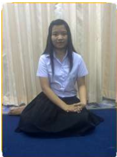
2.1 ลักษณะการนั่ง

นั่งขัดสมาธิบนพื้น หากเป็นสตรีให้นั่งพับเพียบขาขวาทับขาซ้าย วางกะโหลกขอไว้บนขาพับด้านซ้าย มือซ้ายจับคันซอให้ตรงกับที่มีเชือกรัดอก ให้ต่ำกว่าเชือกรัดอกประมาณ 1 นิ้ว ส่วนมือขวาจับคันสี- โดยแบ่งคันสีออกเป็น 5 ส่วน แล้วจับตรง 3 ส่วนให้คันสีพาดไปบนนิ้วชี้ และนิ้วกลาง ในลักษณะหงายมือ ส่วนนิ้วหัวแม่มือ ใช้กำกับคันสี โดยกดลงบนนิ้วชี้ นิ้วนางและนิ้วก้อยให้งอติดกัน เพื่อทำหน้าที่ดันคันชักออกเมื่อจะสีสายเอก และ ดึงเข้าเมื่อจะสีสายทุ้ม