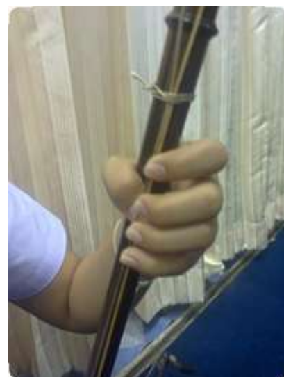
การจับซอ

ข้อควรระวัง ต้องวางซอให้ตรง โดยใช้มือซ้ายจับซอให้พอเหมาะ อย่าให้แน่นเกินไป อย่าให้หลวมจนเกินไป ซ้อมือที่จับซอต้องทอดลงไปให้พอดี ขณะนั่งสียึดคอกพอสมควร อย่าให้หลังโก่งได้ มือที่จับซอให้ออกกำลังพอสมควรอย่าให้ซอพลิกไปมา