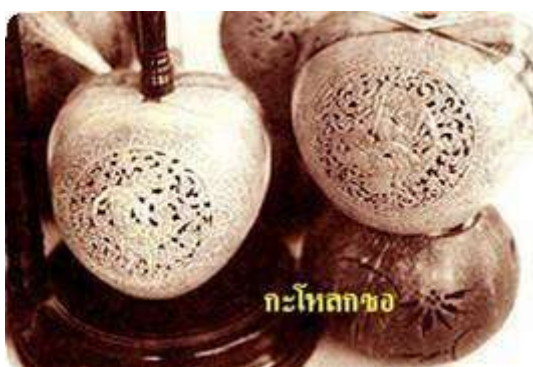
2.3 กะโหลกซอู้

กะโหลก กะโหลกซอู้ นั้นทำมาจากกะลามะพร้าว กะลาที่ตินั้นจะมีทรงเป็นรูปหัวใจ ลักษณะของกะโหลกซอู้ที่กลมไม่มีเหลี่ยม หรือเหลี่ยมน้อยเรียกว่า “ซอพล” ซึ่งจะปาดส่วนของกะลาออกประมาณ 1 ส่วน 4 ตามแนวตั้งของกะลา และเจาะรูไว้เพื่อใส่คันทวนซอแล้วก็มีการแกะสลักลวดลายไว้ด้านตรงข้ามกับหน้าซอเป็นลวดลายต่างๆสวยงาม เช่น ลายเทพต่างๆในตำนาน ลายกนก ลายรามเกียรติ์ ฯลฯ เพื่อให้เสียงออกทางรูขลุ่ยภาพ