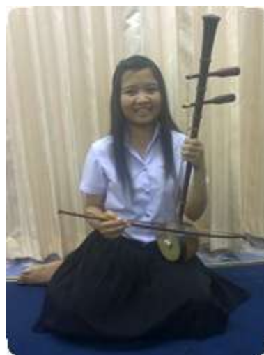
2.2 ลักษณะการนั่งในการบรรเลงซออู้